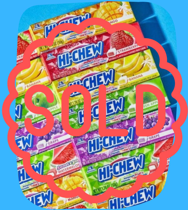
hi chew $10.000