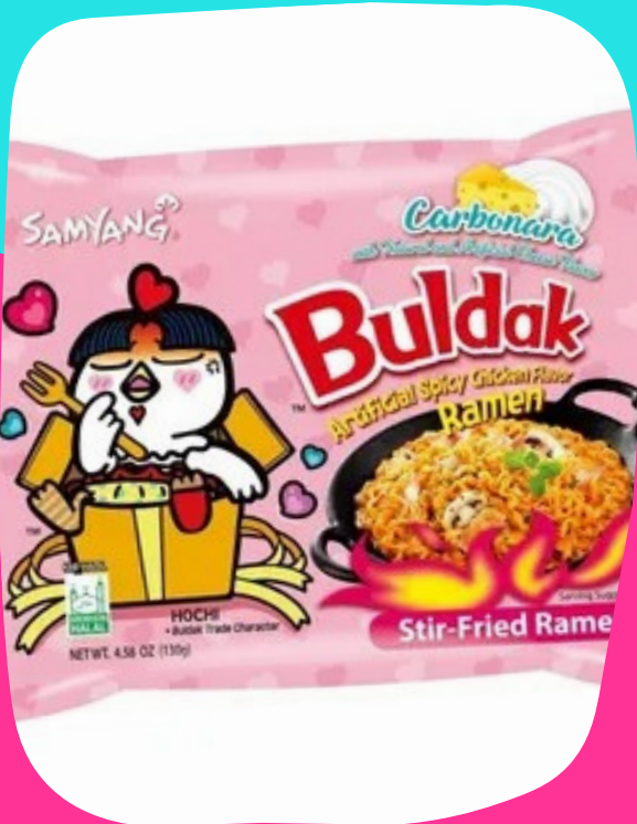
Ramen carbonara $17.000