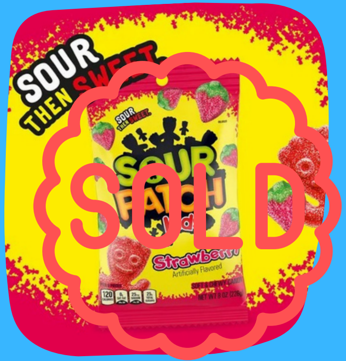
sour patch medianos $16.000