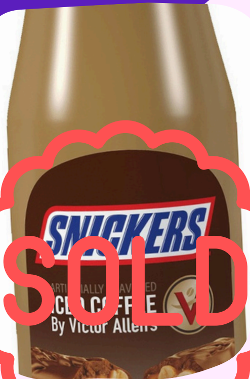
bebida snickers $32.000