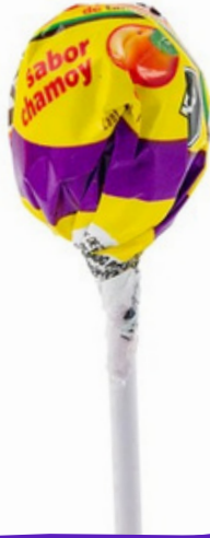
pulparin pop mini $1.500