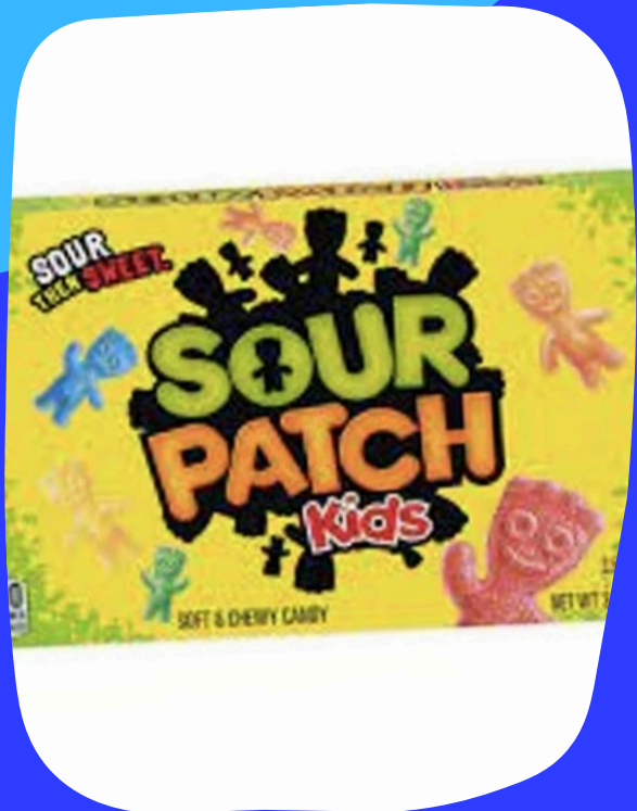
sour patch $10.000