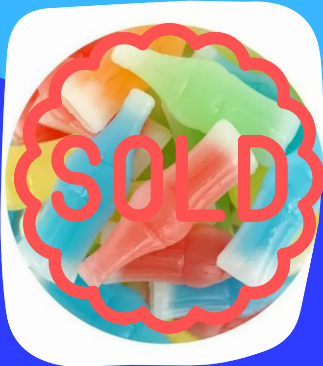
dulce de cera $20.000