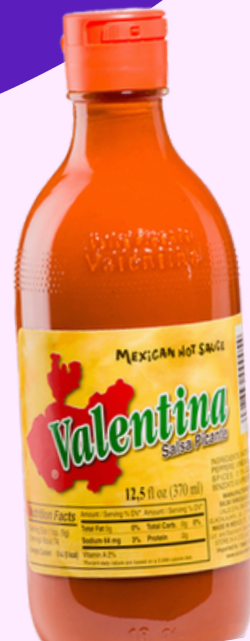
salsa valentina $38.000