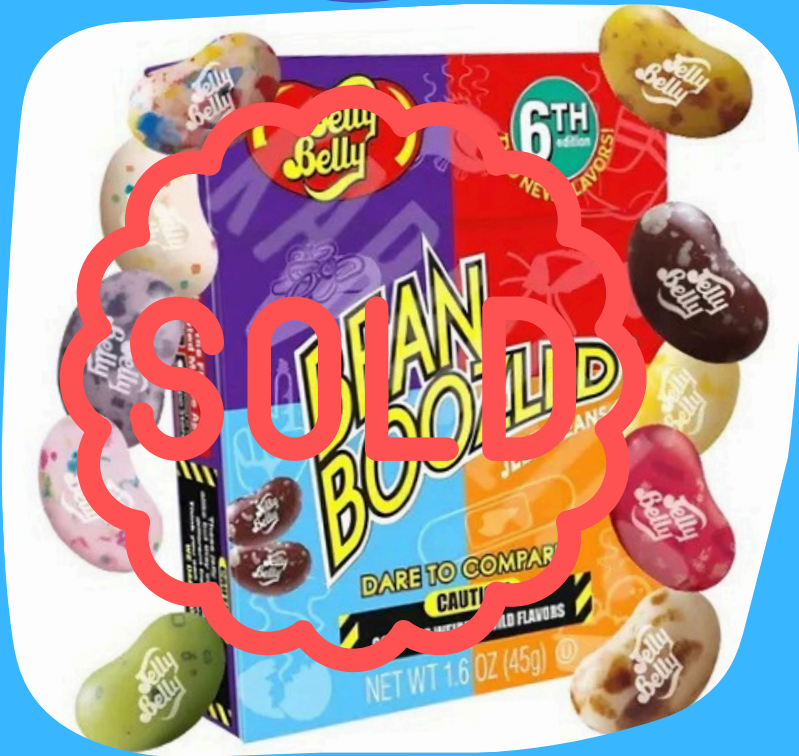
bean boozled $22.000