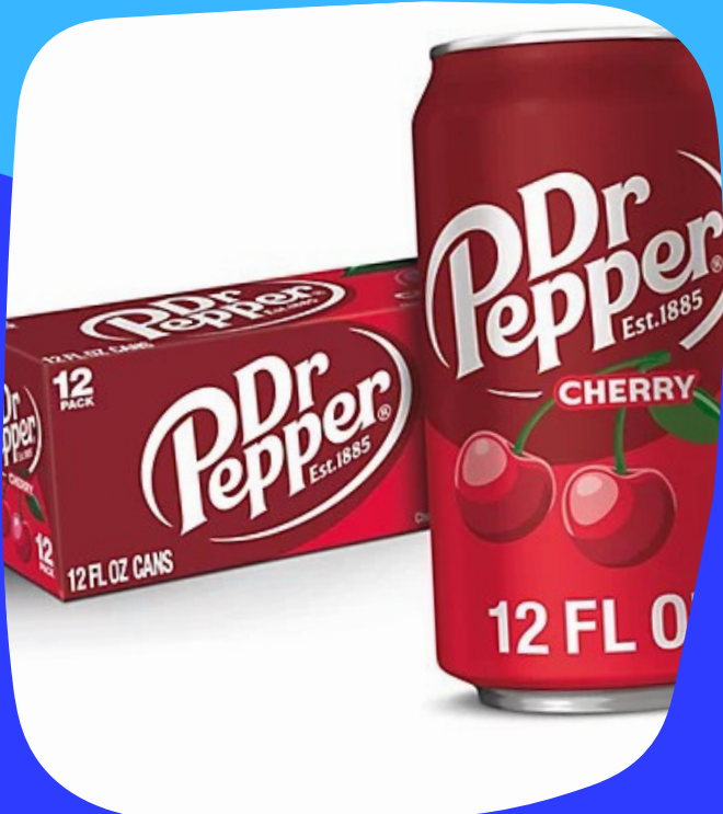
Dr pepper cherry $15.000