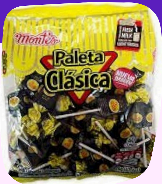
paleta clasica $1.500