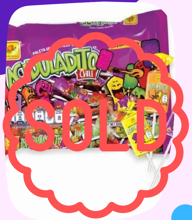
paleta aciduladito 1.500