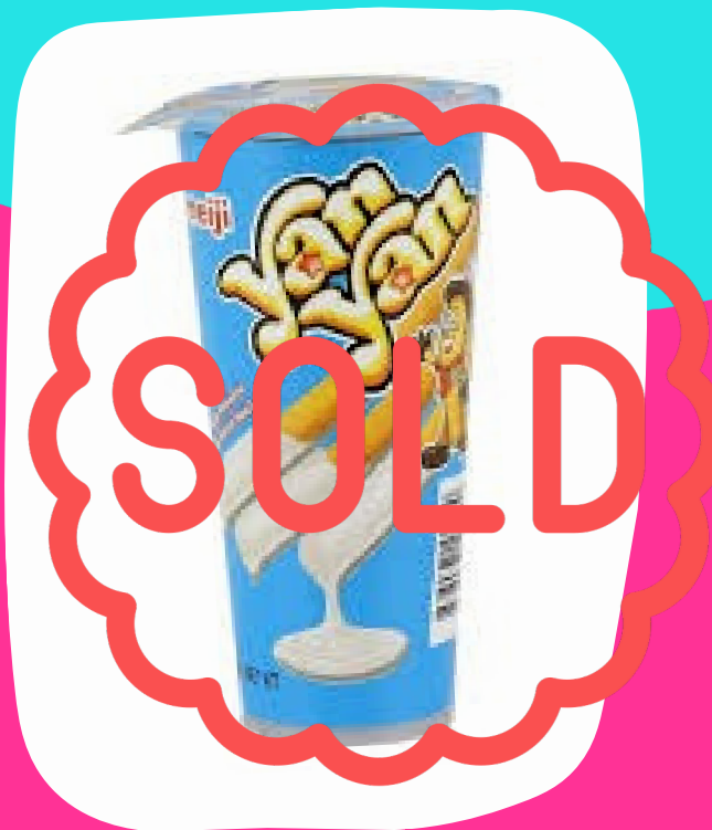
Yan yan $14.000