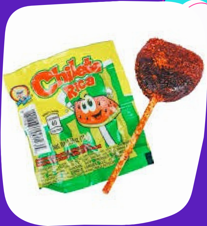
chileta sandia $2.500