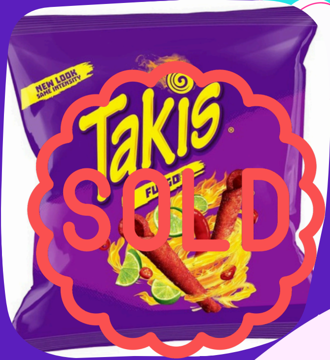
takis mini $7.000