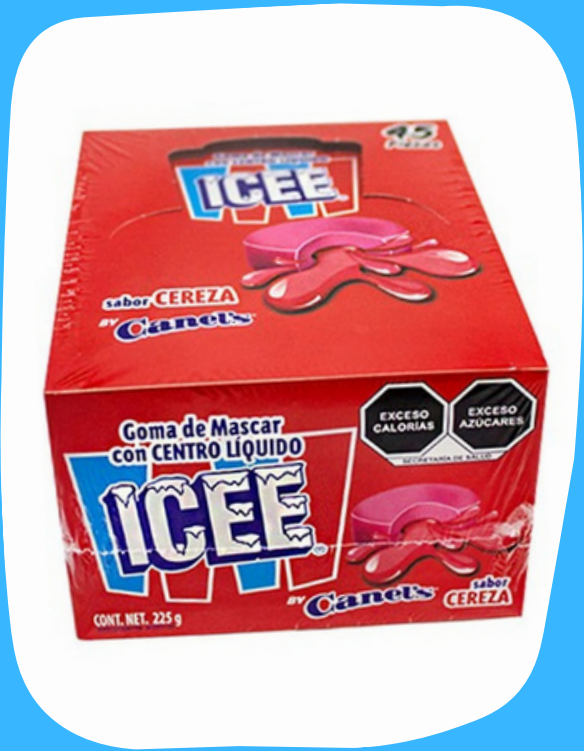
icee goma mascar $600 c/u