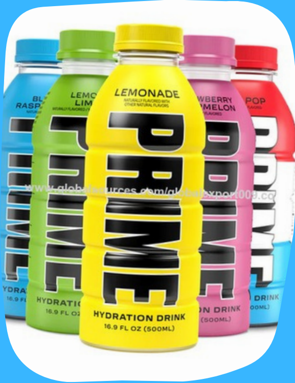
prime pequeña $19.000