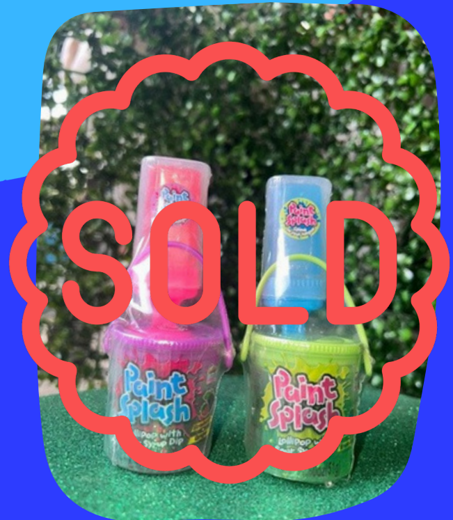
paint splash $13.000