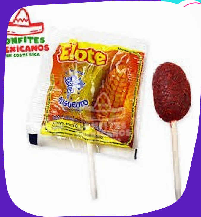
miguelito sandia mango elote y piña $3.000