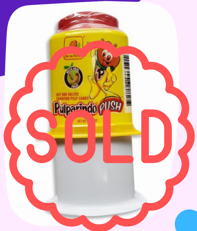
pulparindo push $7.500