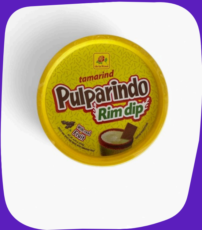
pulparindo rim dip $50.000