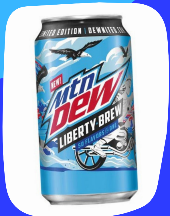
mountain dew $15.000