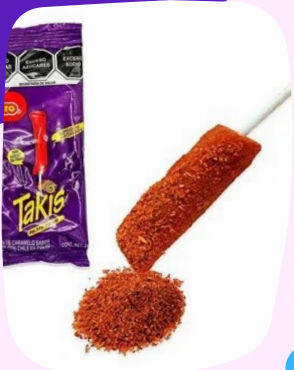
takis chupeta $9.000