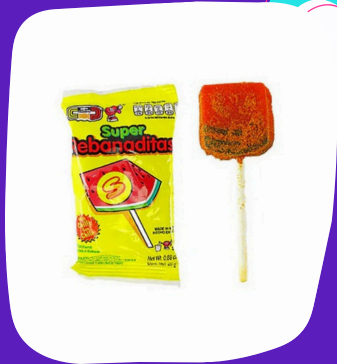
super rebanadita $5.000