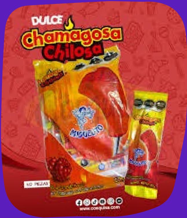
chamagosa chilosa $2.500