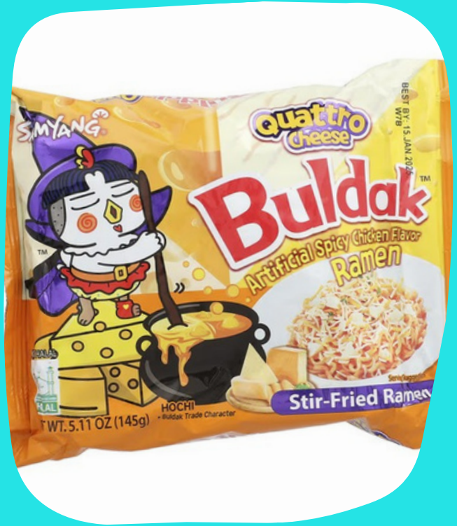
Ramen 4 quesos $17.000