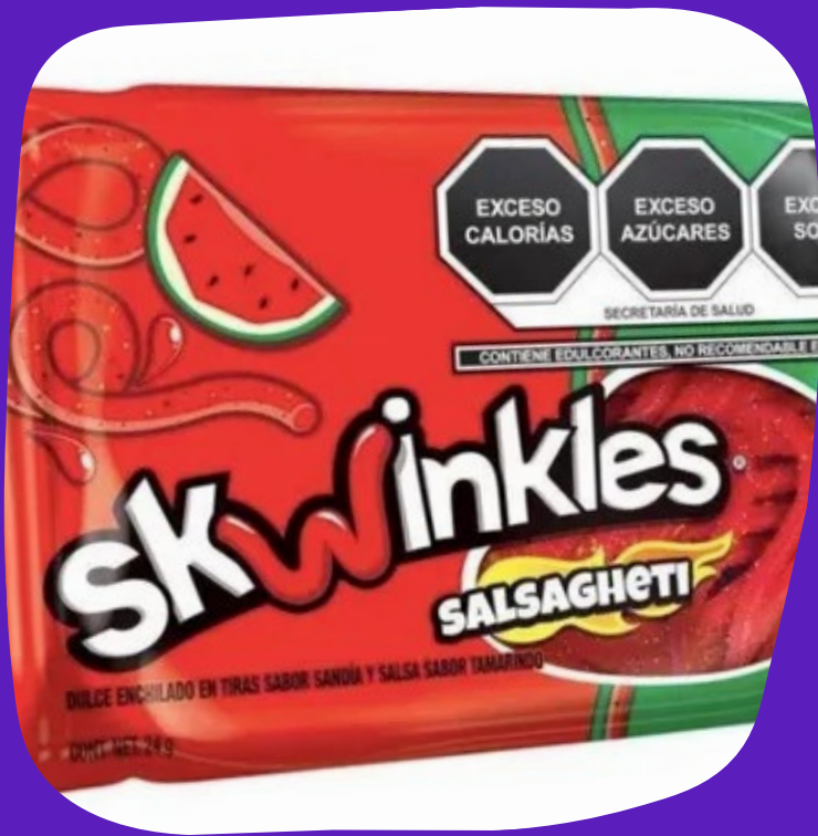
skwinkles salsagheti $7.000