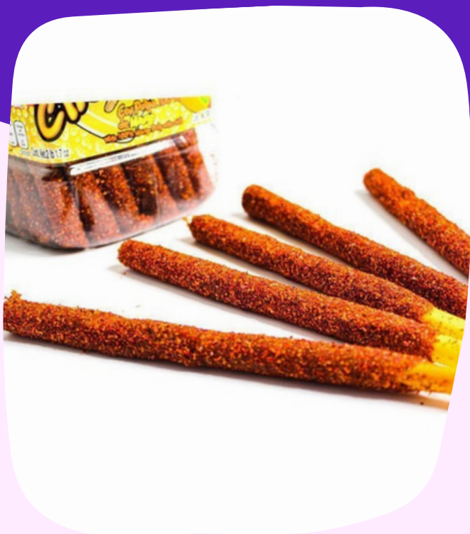
chelinas unidad $3.500