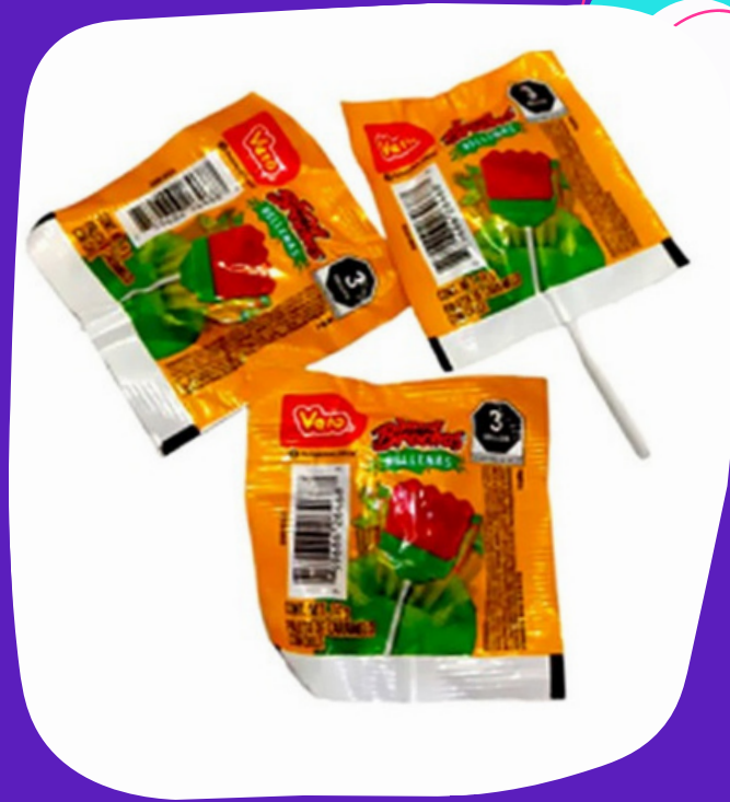
sandi brocha rellena $2.500