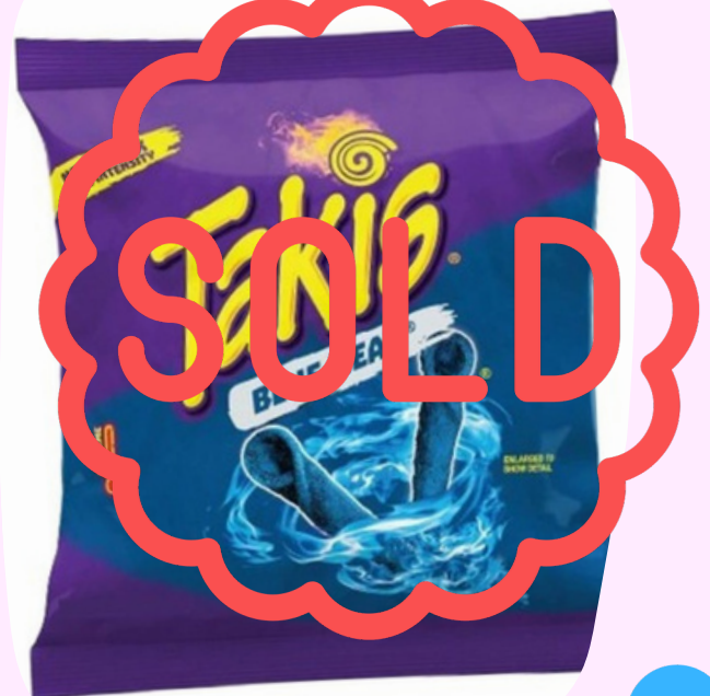
takis blue $6.500