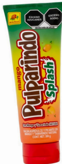
pulparindo splash $50.000