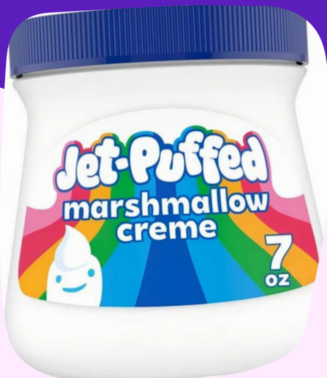
jef puffed $28.000