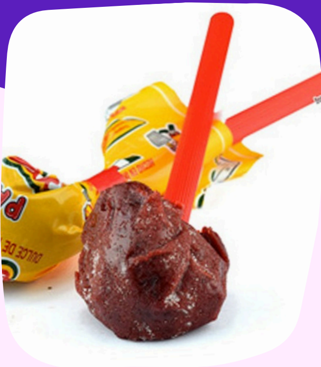
pale bola $6.500