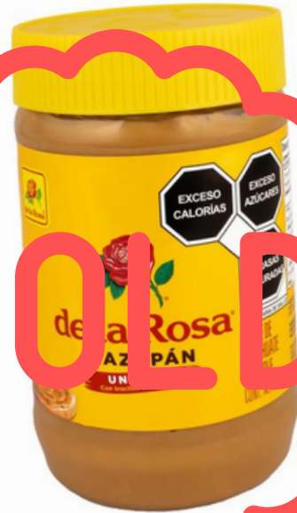
crema mazapan $59.000