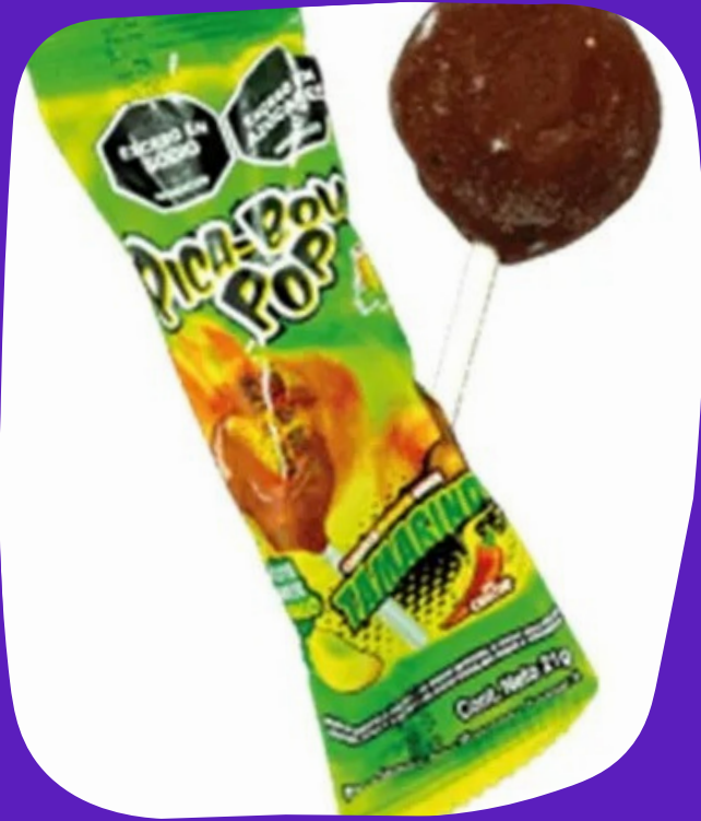
pica bola pop $4.000