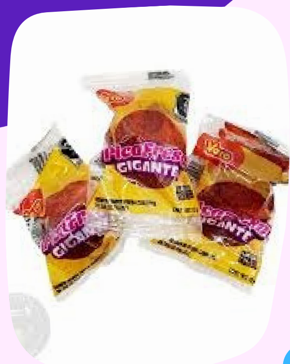
picafresa grande $1.500