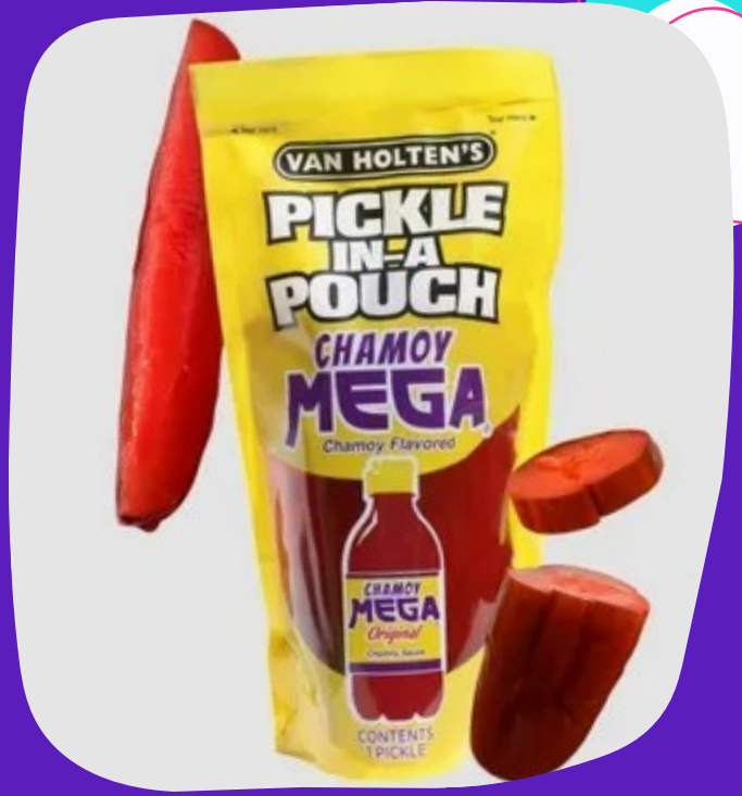
pepino mexicano $55.000