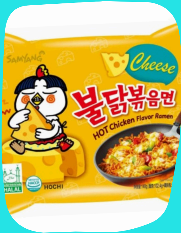
Ramen queso $17.000