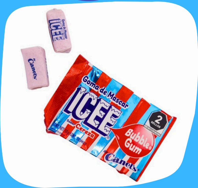
icee goma chicle $6.000