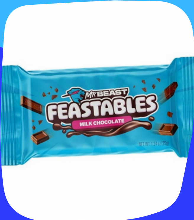
mr beast chocolate $15.000