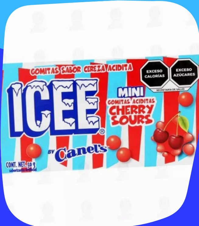
icee cereza $7.000