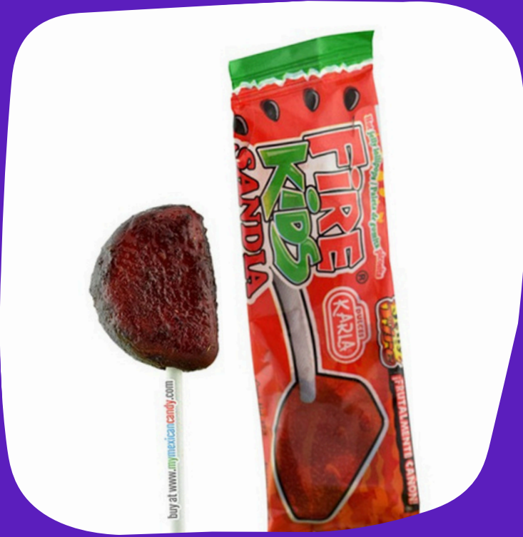
fire kids sandia $2.500