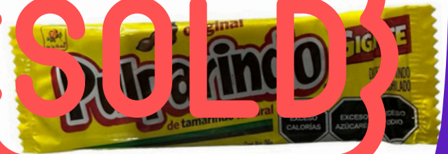
pulparindo gigante $4.500