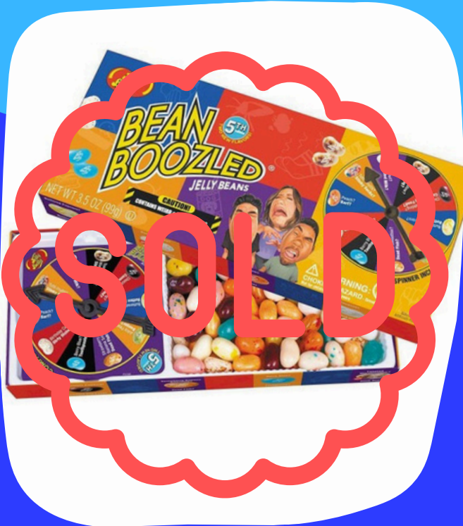
ruleta bean boozled $54.000