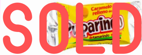
pulparindo relleno $1.200