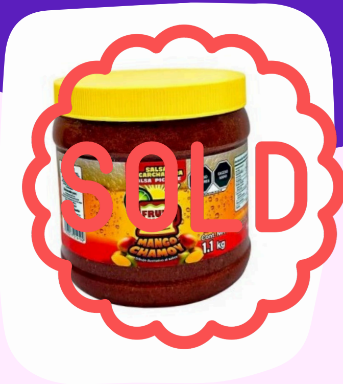
salsa escarchadora $60.000