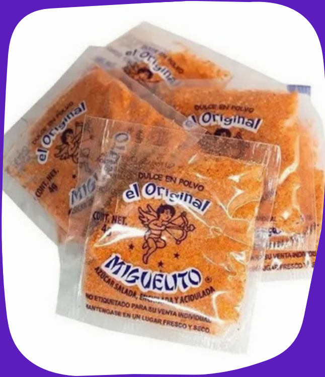
miguelito en sobre $2.500