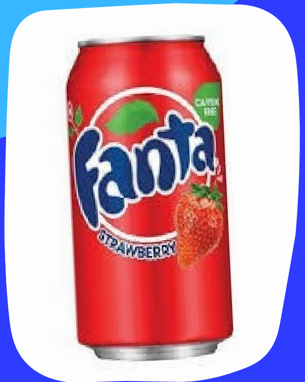
fanta fresa $15.000