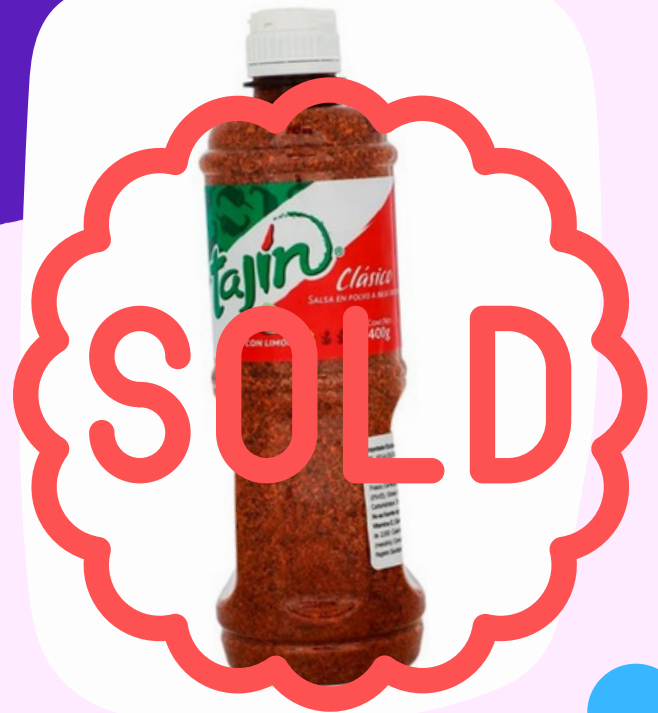
tajin grande $34.000