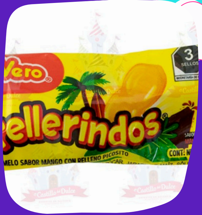
jellerindo mango $1.500