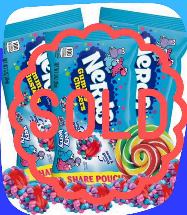
nerds gummy pequeños $15.000