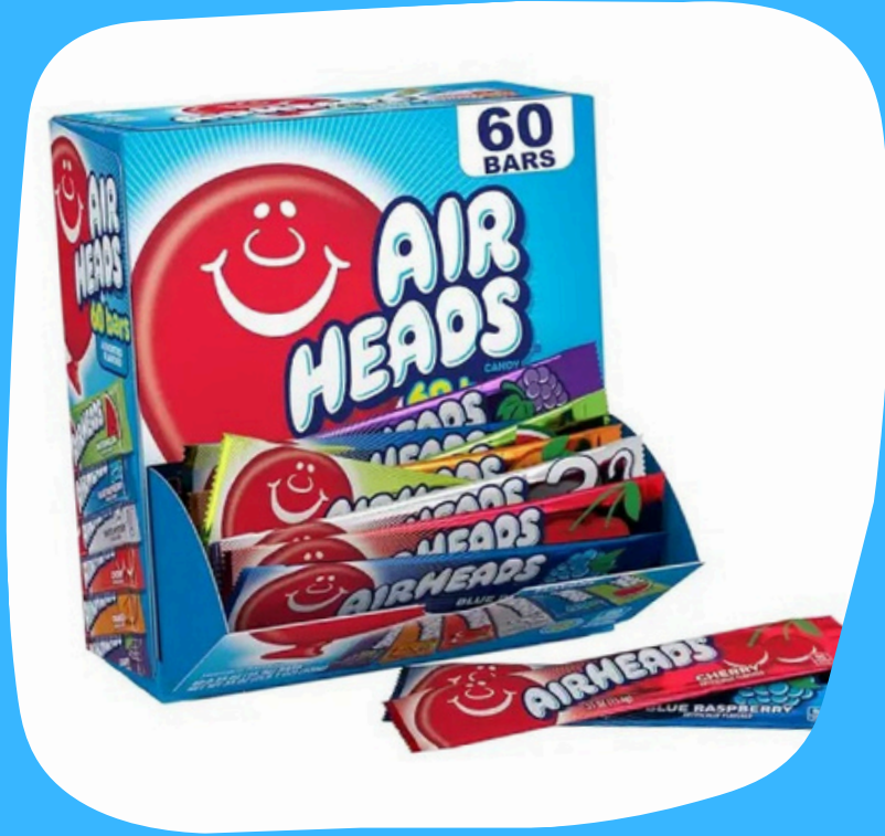
air head barra $3.000