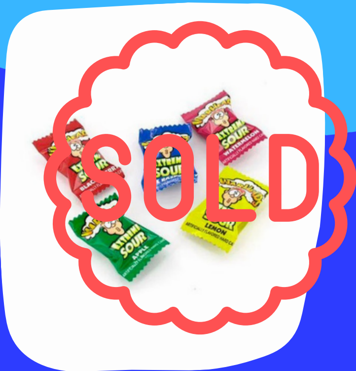
war heads dulces $1.500