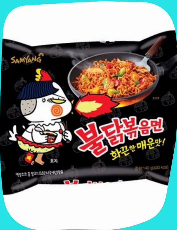
Ramen pollo picante $17.000