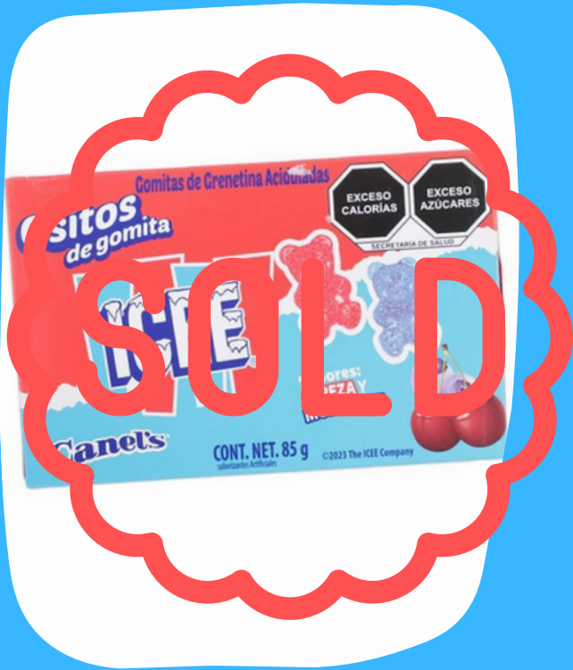
icee osito gomas $12.000