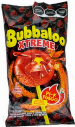
bubaloo extreme $4.000