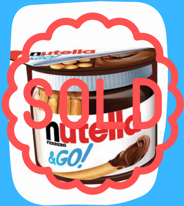
nutela go $11.000