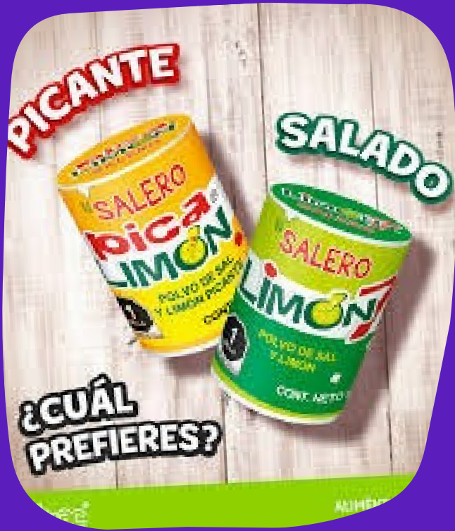
salero sabores $5.000