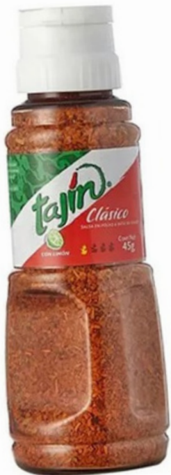
tajin pequeño $19.000