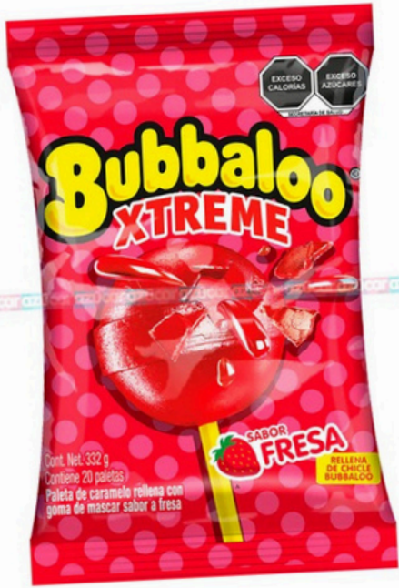
bubaloo extrem fresa $4.000