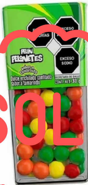
pelon pelonetes pote $14.000