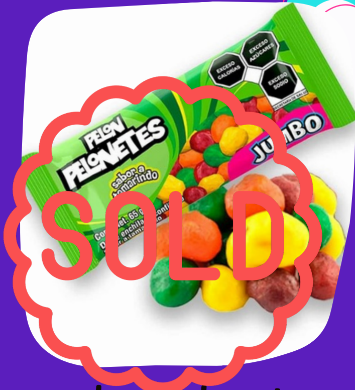
pelon pelonetes $3.000