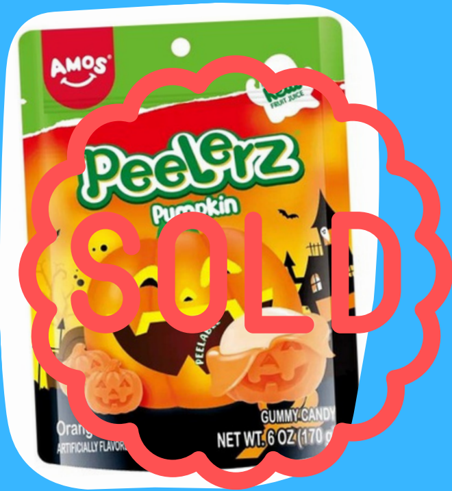
peelerz halloween $34.000