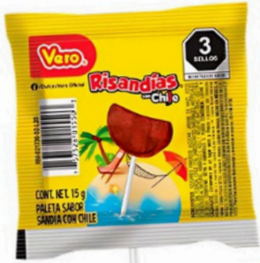
risandia vero $3.000