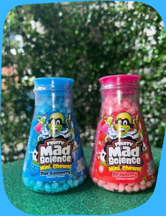
mad science $13.000