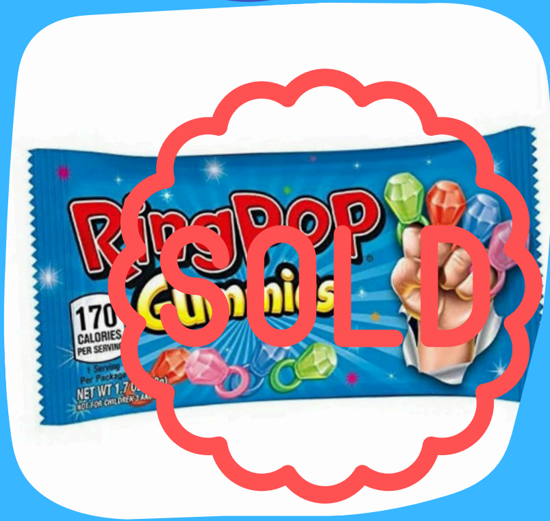
ring pop gummy rings $11.000