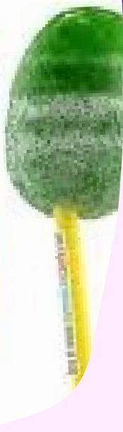
paleta salimon $2.500