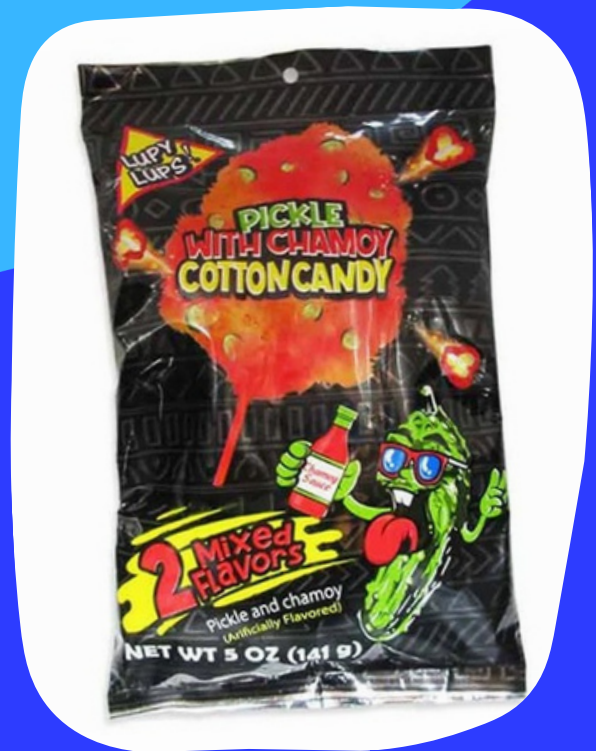
algodon dulce y picante $47.000