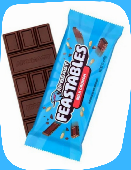
mr beast grande $26.000