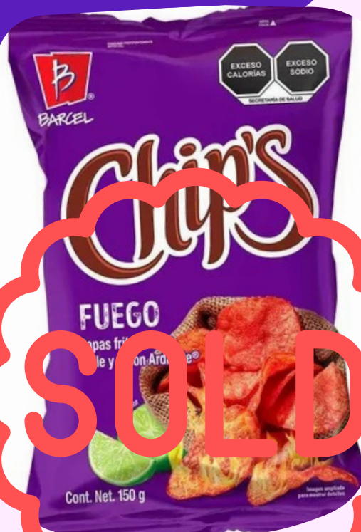
papas chips $7.700