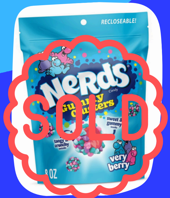
nerds gummy grande $33.000