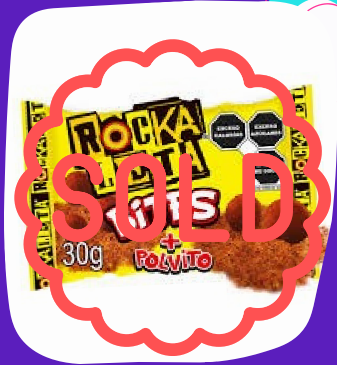
rockaleta bites $7.000