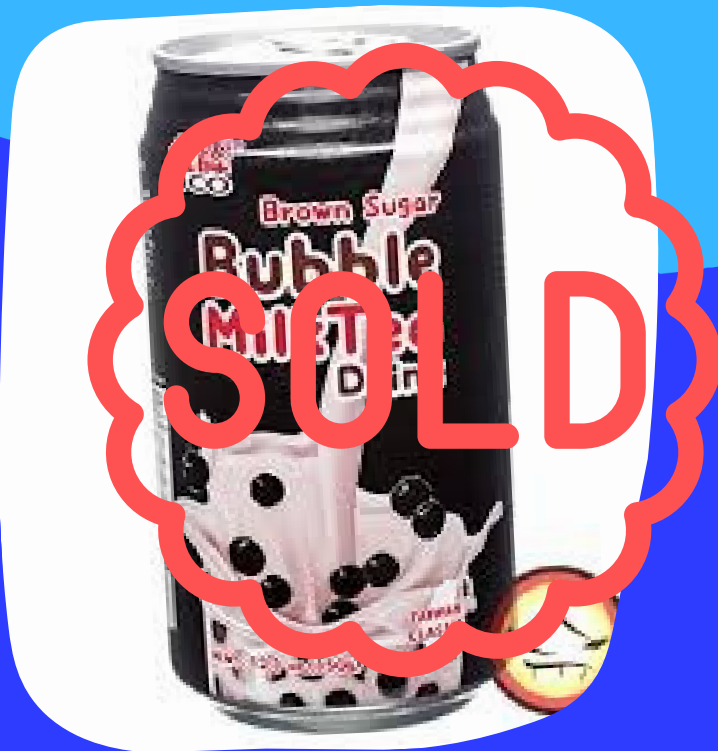
bubble milk $27.000