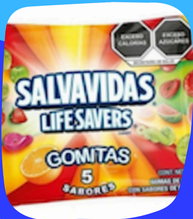
gomas salvaVIDAS $8.000