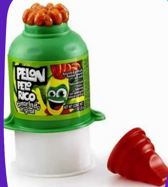
pelon pelo rico $7.000