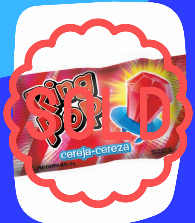
ring pop $3.500