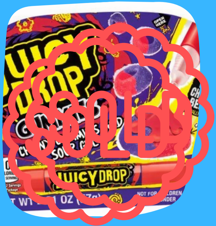
gummy lapicero $13.000