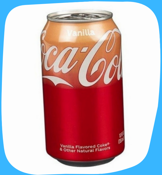
coca cola vainilla $15.000