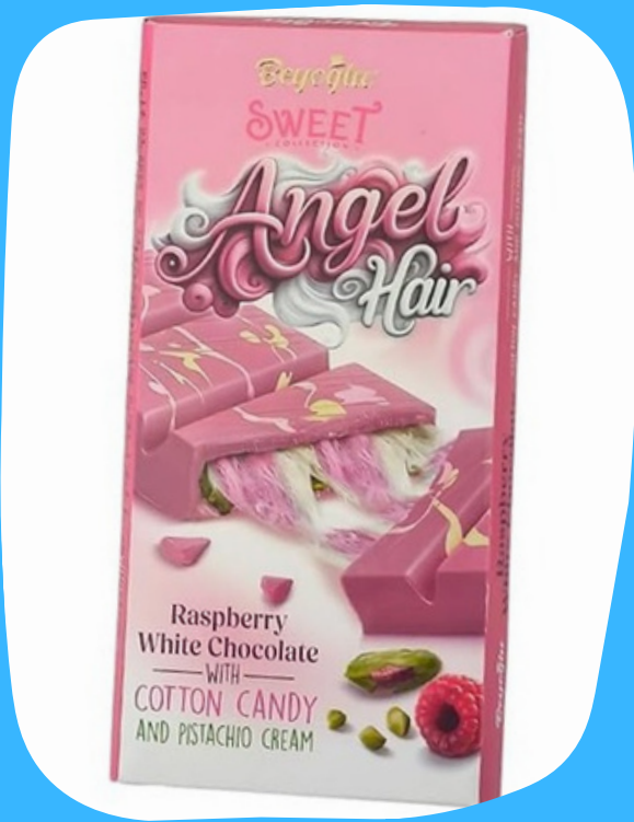
chocolatina dubai grande $120.000