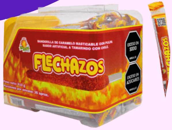
flechazos banderillas $3.500