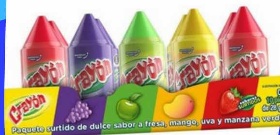
crayon de dulce $5.000