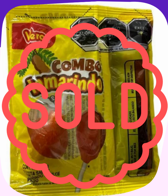
combo vero $9.000