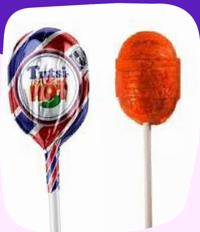
tutsi hot $2.500