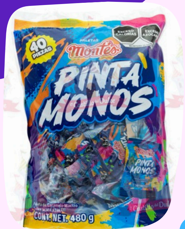
pinta mono $1.500