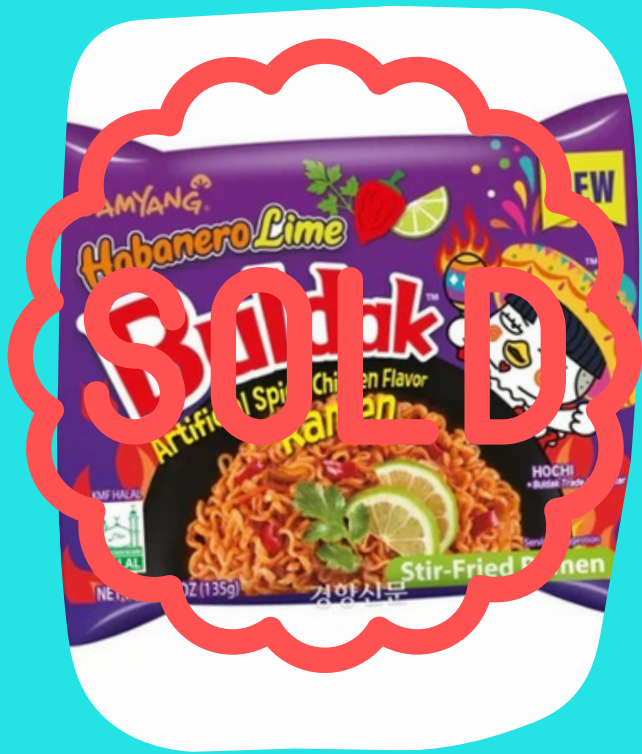
Ramen habanero limon