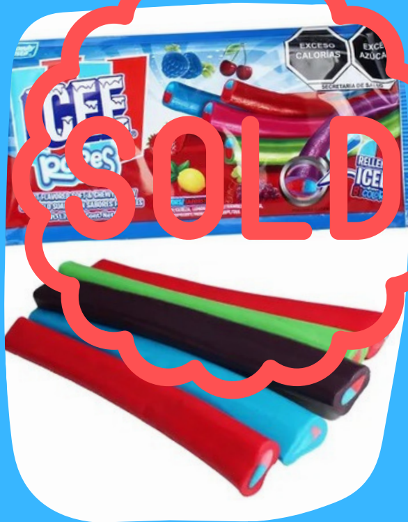
icee rope gomas