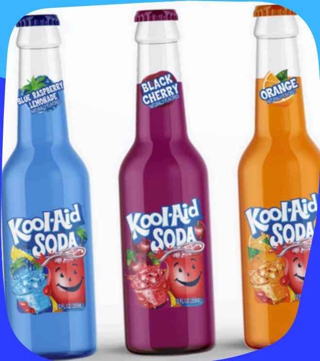
kool aid soda