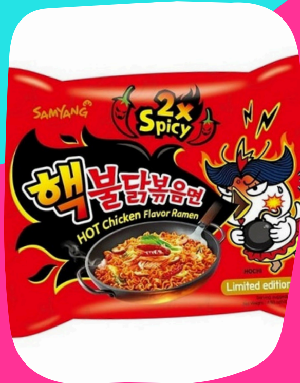
ramen pollo picante x2 $17.000