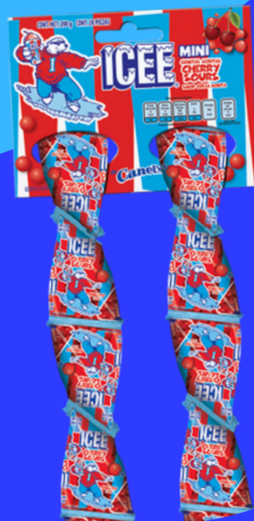
icee cojin $3.000