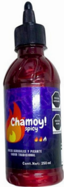
chamoy spicy $19.000