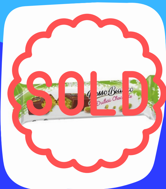
chocolatina dubaio pequeña