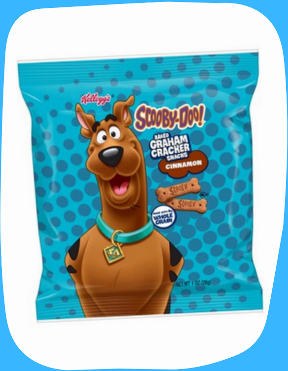
galletas scooby doo $7.000