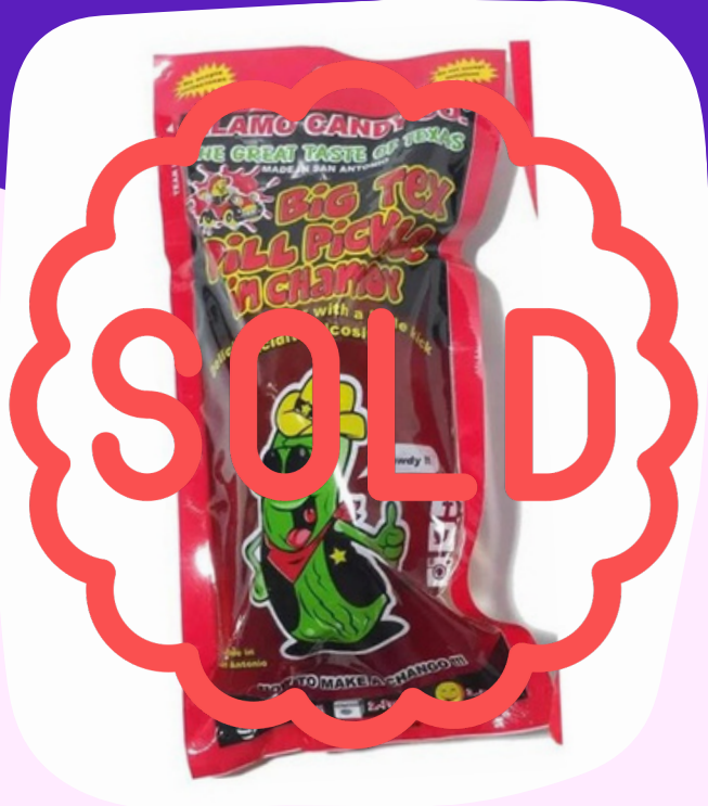
pepino texas (americano) $60.000