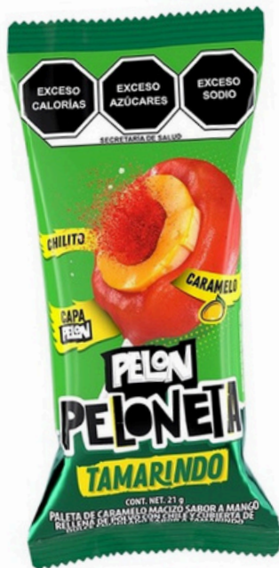
pelon peloneta $4.000