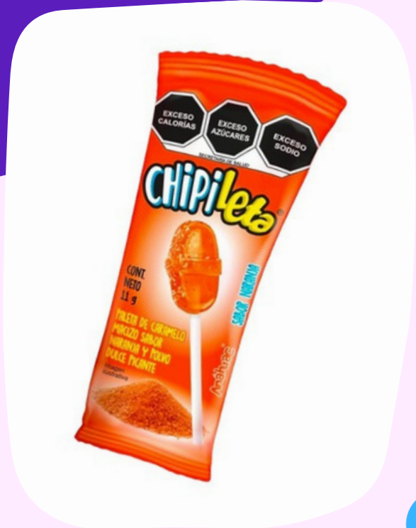
pachileta dulce $4.500