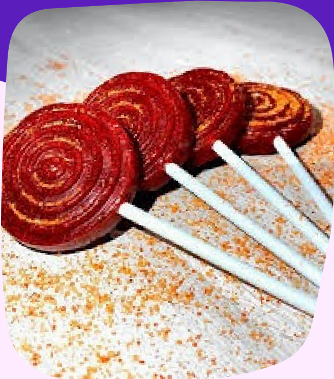
raqueta enchilada $3.000