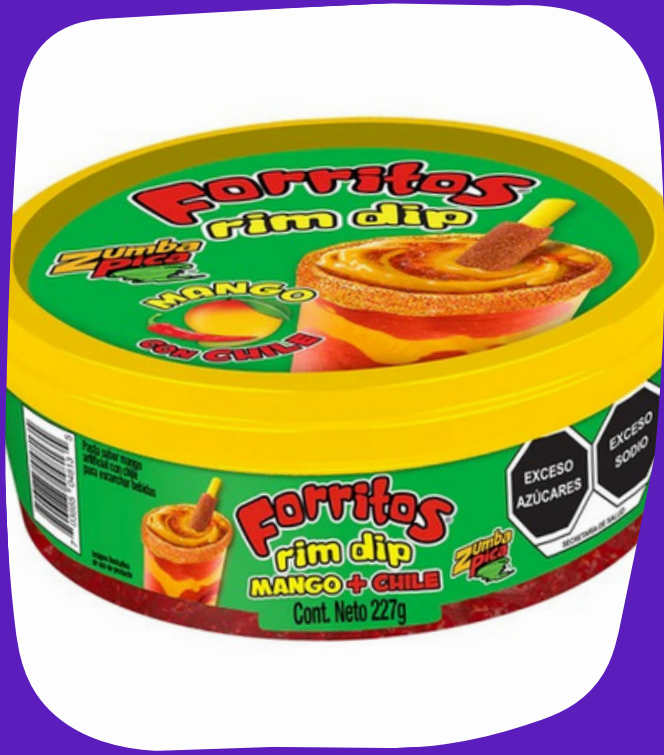
forritos rim dip $45.000