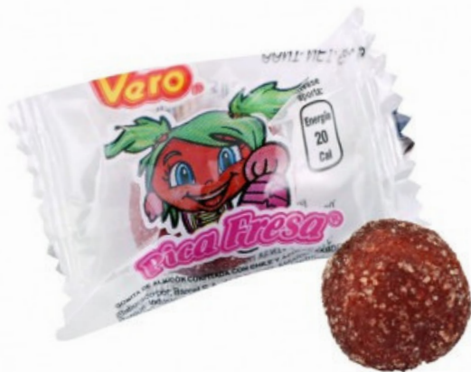
picafresa pequeña $1.200