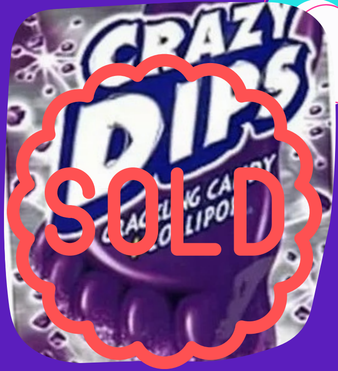
crazy dips $6.000