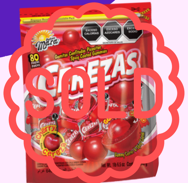
mara cereza $1.000