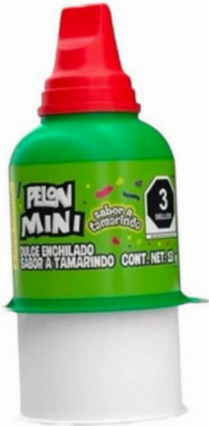
pelon mini $4.500