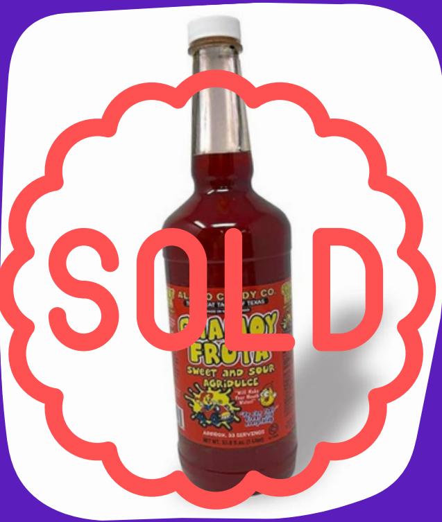
chamoy de frutás $25.000