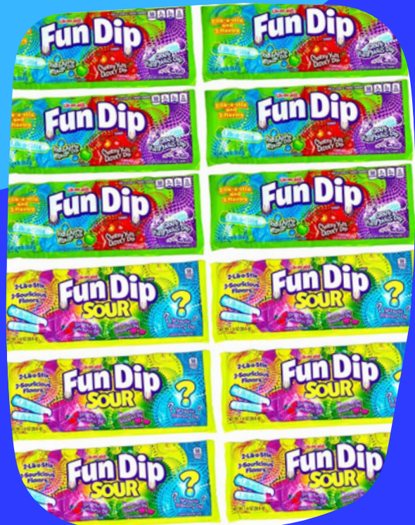
fun dip $27.000