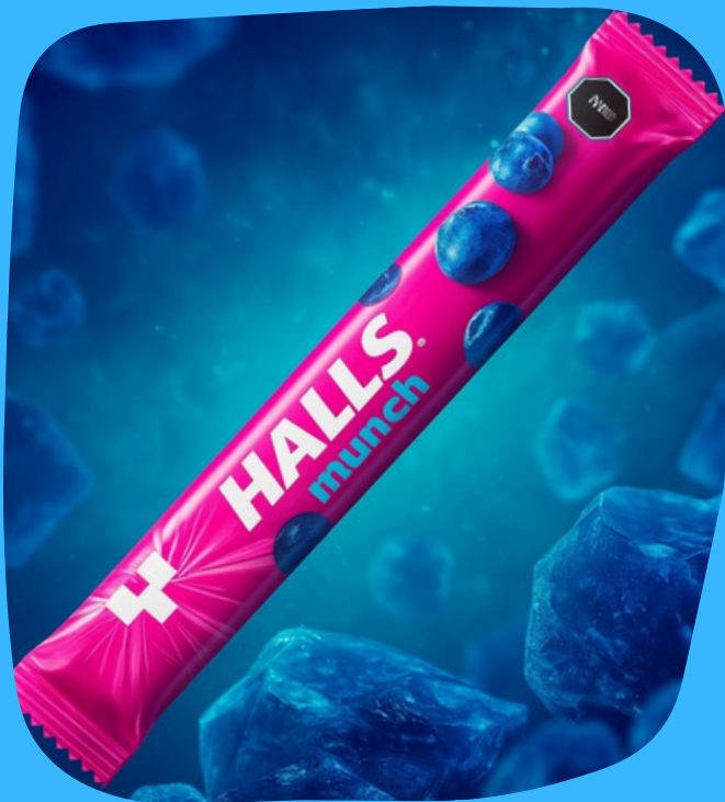
halls munch $3.000