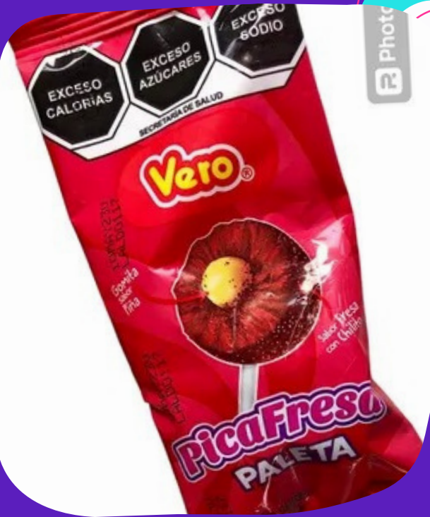
paleta picafresa $10.000