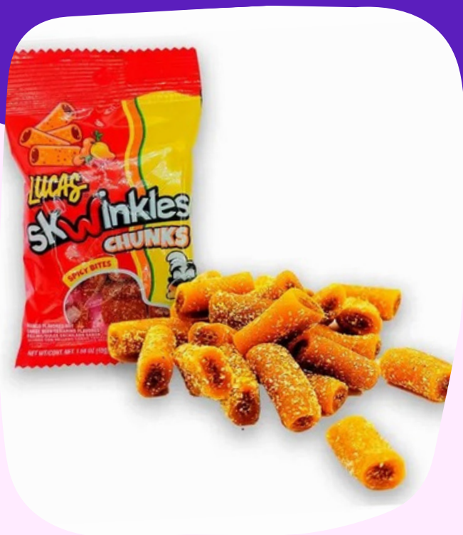
skwinkles chunks $8.000