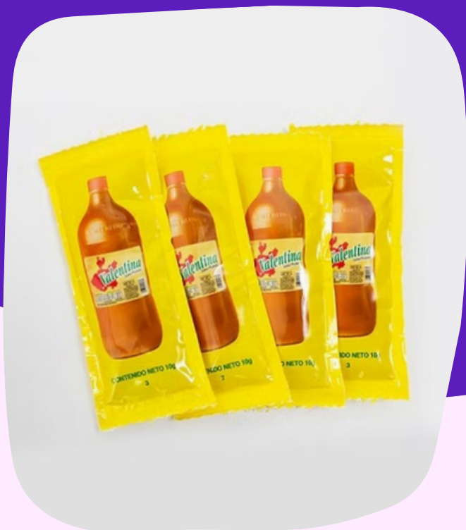
salsa valentina sobre