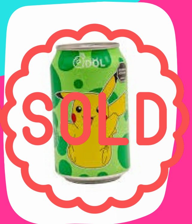
Soda pokemon $28.000