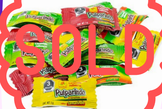
pulparindo caramelo $1.200