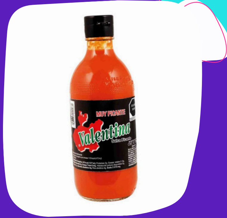
salsa valentina negra $39.000