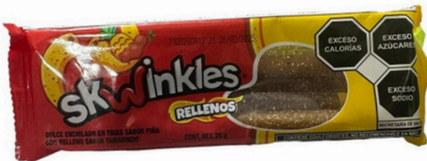
skwinkles rellenos $6.500