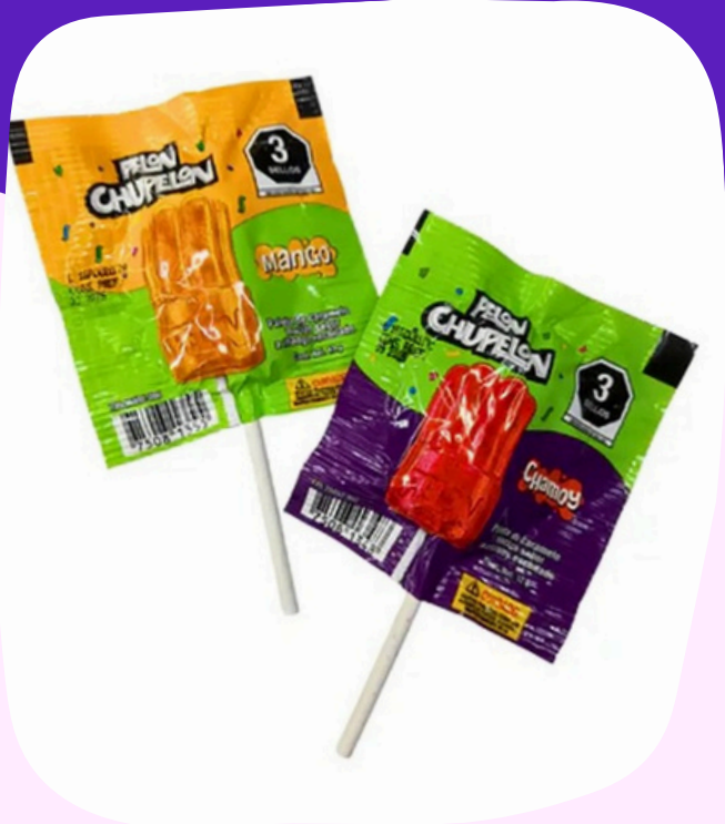
pelon chupelon $2.500