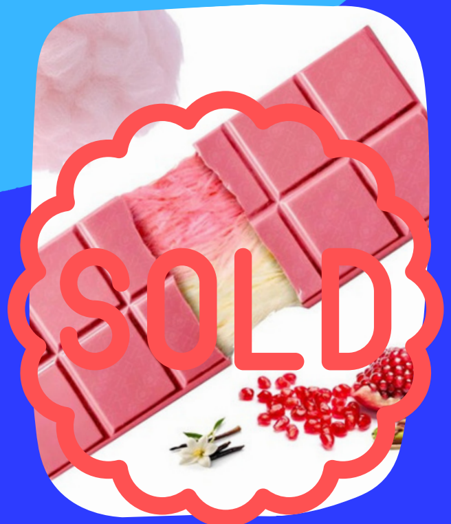
chocolatina dubai media