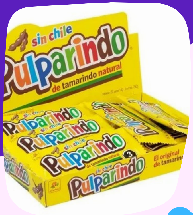
pulparindo sin chile